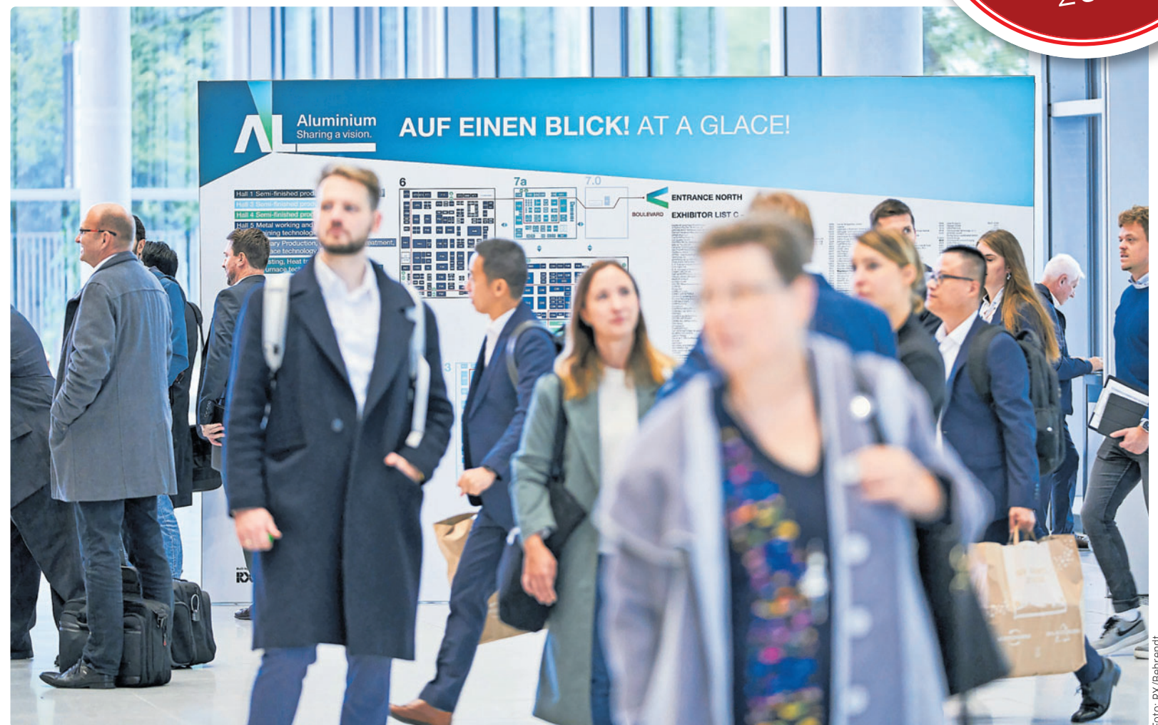
Das Messe-Motto „Sharing a Vision“ beschreibt die gemeinsame Vision, Aluminium als nachhaltiges und zukunftsfähiges Material zu etablieren