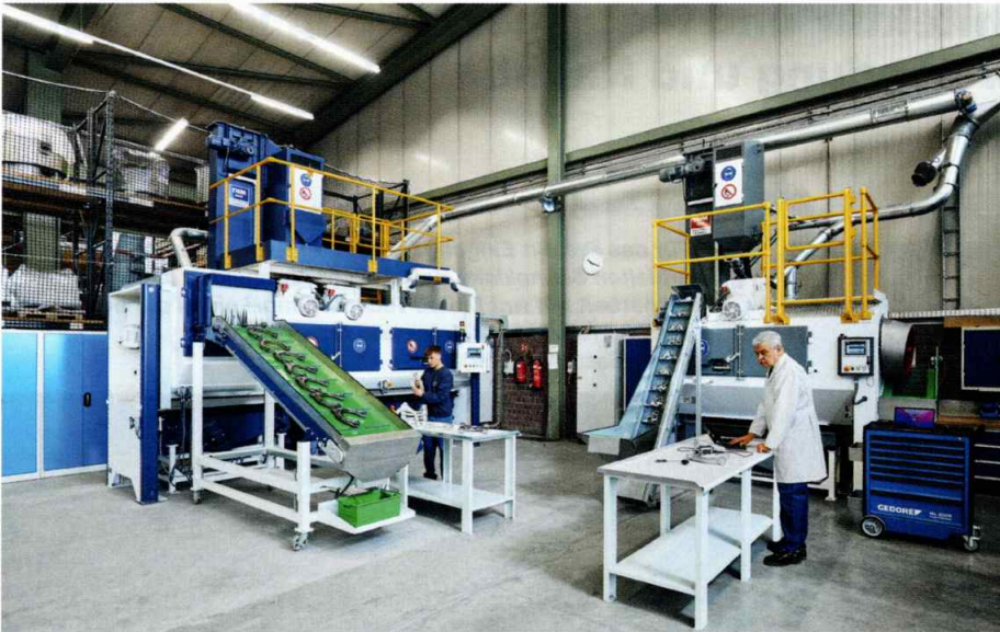
Im Trowal Test- und Trainingscenter in Haan stehen mehrere THM Strahlanlagen für Versuche zur Verfügung.

Für jeden Werkstücktyp wird anhand von Versuchen ermittelt, welche Parameter – unter anderem Drehzahl der Turbinen und Strahlmitteldurchsatz – zum gewünschten Ergebnis führen. Daraus entstehen Rezeptfamilien, die in der Anlage hinterlegt werden.